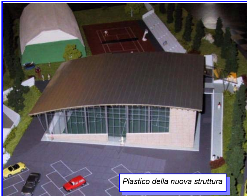
Plastico della nuova struttura

del magazzino e, al piano primo, di sale per le associazioni sportive con relativi servizi.