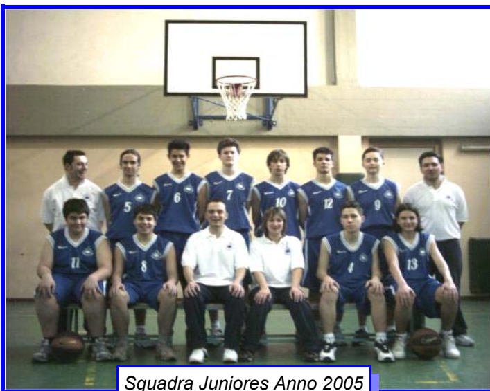
Squadra Juniores Anno 2005

Per qualsiasi informazione potete visitare il nostro sito internet all'indirizzo http://xoomer.virgilio.it/pallcastiglione nel quale potete trovare tutte le notizie riguardanti la nostra associazione, i risultati, le statistiche e le foto delle nostre squadre oltre ai numeri telefonici e gli indirizzi e-mail ai quali potete contattarci.