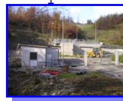
Il nuovo depuratore