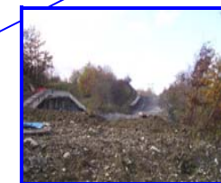
La nuova tangenziale VS 18