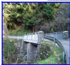
Ristrutturazione Ponte degli Spiriti