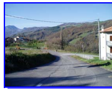
La nuova strada della Chiesa Vecchia