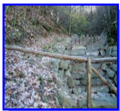
Risanamento fosso Berti