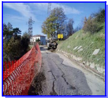
Sistemazione Strada Comunale