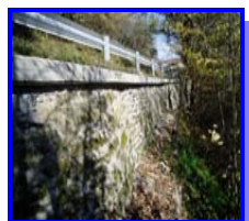
Ristrutturazione muro ai Baguacci