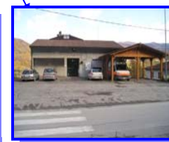
Il nuovo servizio 118