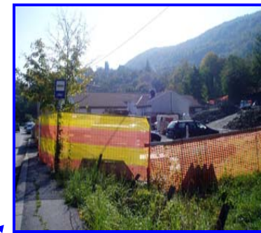
Il nuovo asilo nido nei pressi del polo scolastico