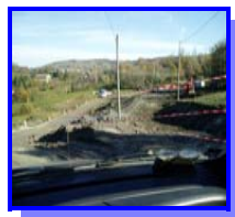
Lavori di consolidamento Famadiccia