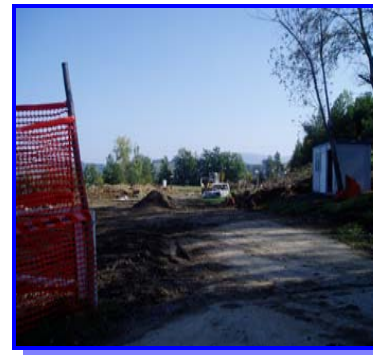
Impianti sportivi all'aperto nell'ex campo S. Giovanni