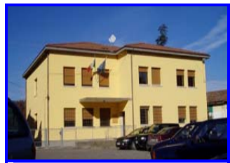
Sistemazione Scuole Elementari