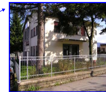
Lavori di sistemazione Scuola Elementare