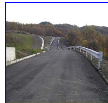
La nuova strada di collegamento al casello