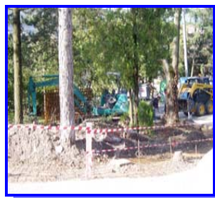
Nuovi giardini a Ca' dei Cerri